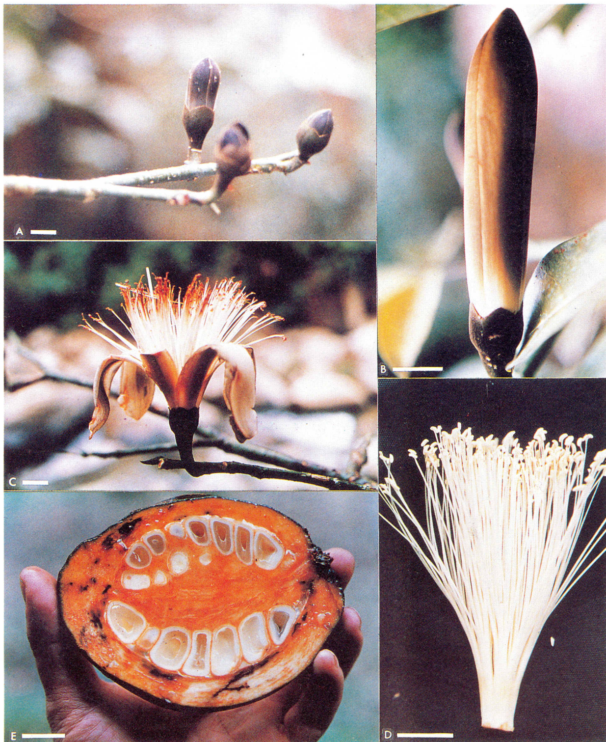
Figura 2. Pachira patinoi A. Rama defoliada con botones florales jóvenes en su posición natural. B. Botón floral completamente desarrollado antes de la antesis. C. Flor en antesis. D. Androceo completamente desarrollado, en el momento de la apertura. E. Corte sagital del fruto inmaduro. Escala, en todas las fotografías= 2 cm.