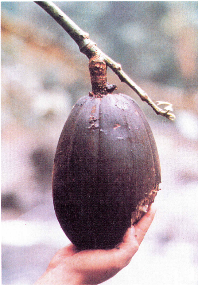
Figura 3. Fruto maduro de Pachira patinoi .

14 cm de diámetro en la antesis; 5 pétalos patente-recurvados en la floración, desde linear-oblancoeados a espatulados, de hasta 14,5 x 3,4 cm de anchura, mas anchos en el tercio distal, externamente de color crema en el tercio basal y pardo-verdoso en los 2/3 distales, en la cara interna blancos, con indumento marrón estrellado en la cara externa y marrón-pajizo en la cara interna (en seco). Androceo: estambres con filamentos de de hasta 10,5 cm de longitud, blancos o blanco-crema, soldados en tubo basal de 1,7-2 cm de longitud, fascículos primarios de c. 3 cm de longitud, filamentos libres de 5-6 cm de longitud, en número de c. 450; anteras de 2 mm de longitud x 0,9 mm de anchura, café ocre; pistilo blanco de 11-12 cm de longitud, glabro. Frutos con pedúnculo fructífero color café, de hasta 2,5 cm x 1,5 cm; cápsulas crasas, péndulas, generalmente maduras cuando el árbol está sin hoja, de hasta 15 cm x 10-13 cm de ancho, ovoide-globosas, comprimidas en el ápice y en la base, exocarpo de café-