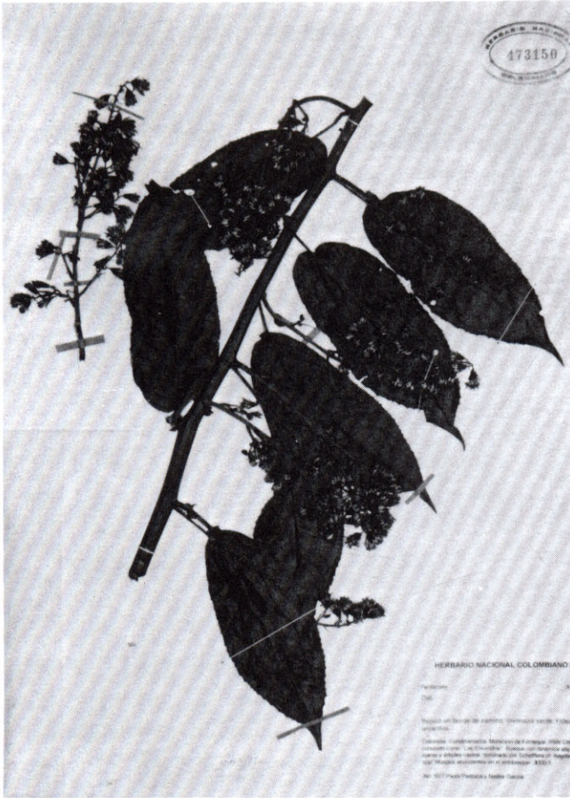
Figura 1. Pentacalia axillariflora S. Díaz & P. Pedraza. Pliego del ejemplar típico.

de 2.7 mm long, apéndice apical de 0.4 mm, base caudada, conectivo de 0.2 mm, porción libre de los filamentos de 4.4 mm long. Ramas estigmáticas delgadas, papilosas en las márgenes y con un mechón apical de pelos. Aquenio elíptico de 1.2 – 1.6 mm long, glabro y con ocho costillas, pappus de 4.3 – 5.5 mm long, setas blancas, escábridas, unidas en la base.